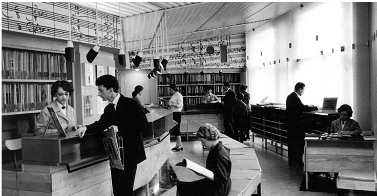
« Discothèque Marigny »