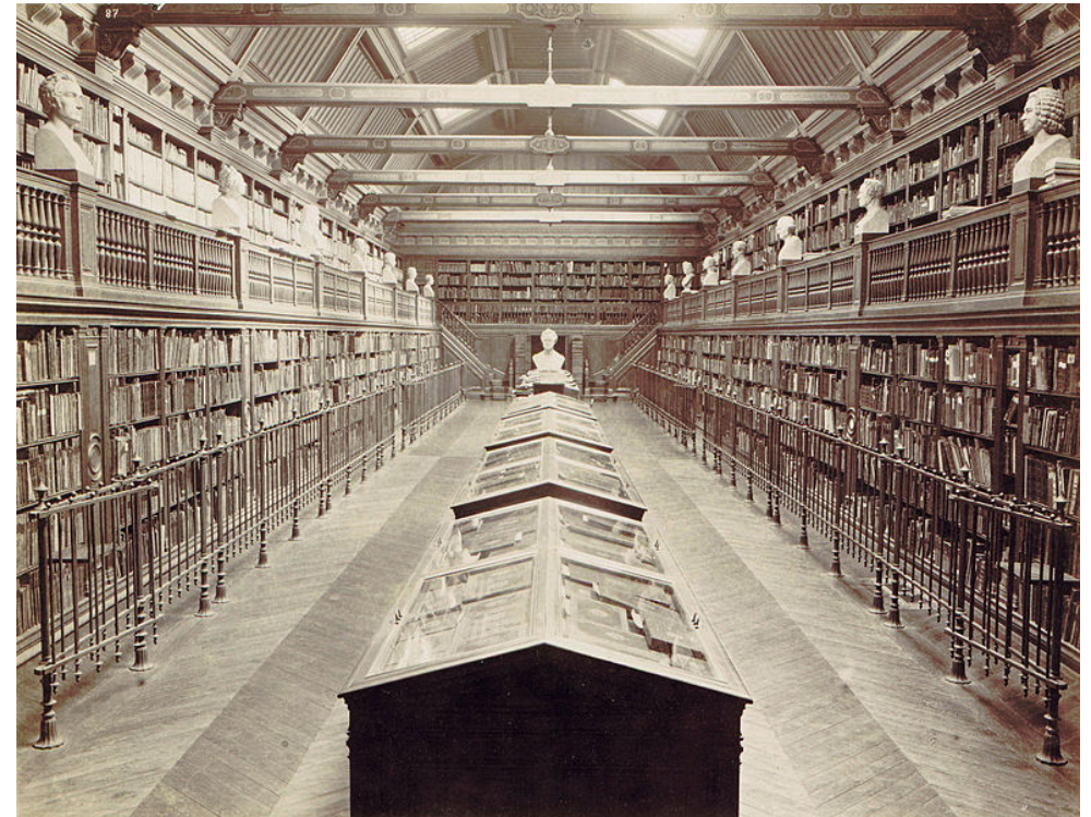
Bibliothèque du Conservatoire national de musique 1895