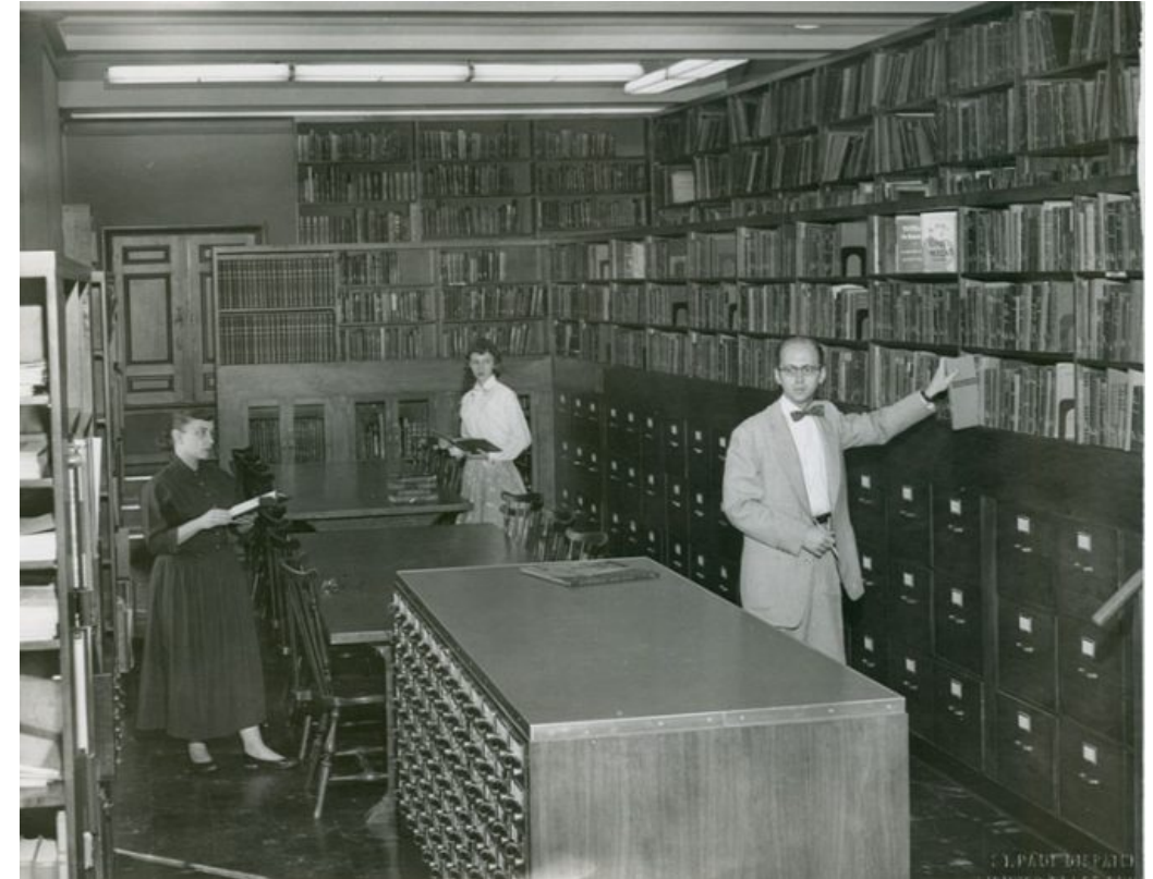
Saint Paul Library, Minnesota