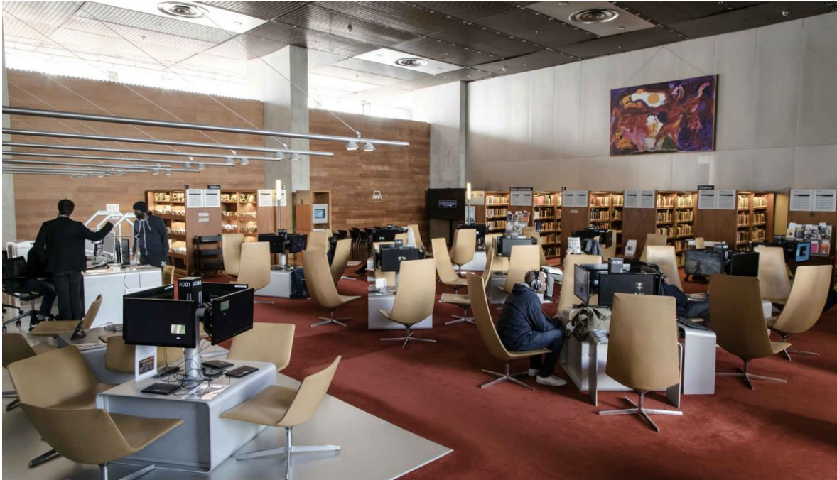
Salle A – Site François-Mitterrand