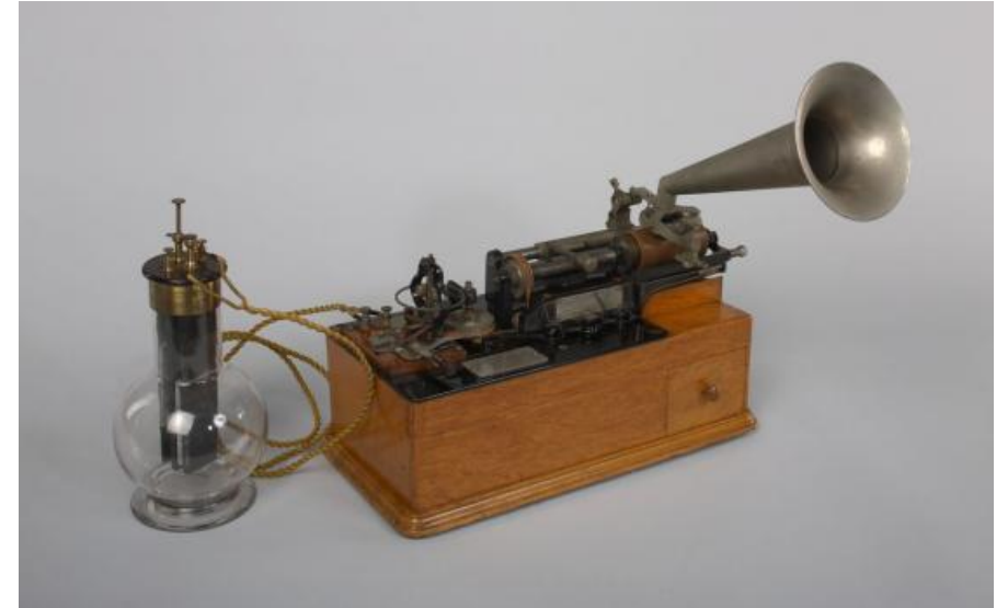
Phonographe à cylindre Edison Class M