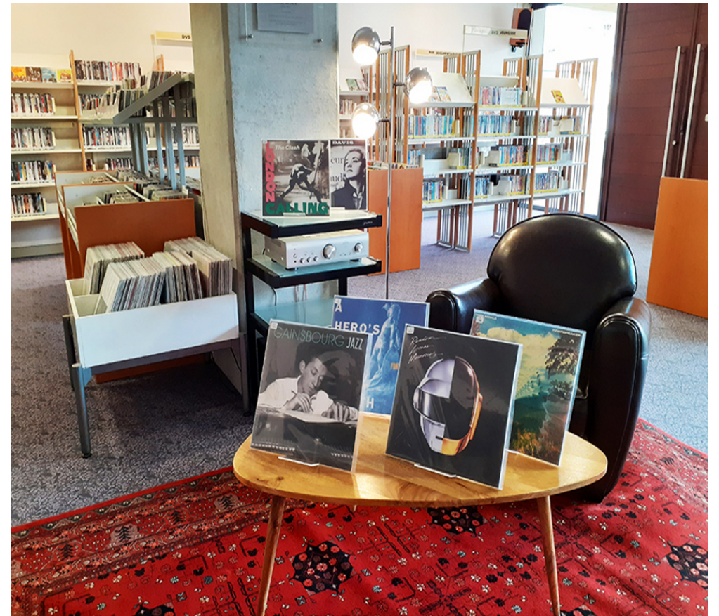
Le salon vinyle de la médiathèque Paul-Raudel de Saint-Grégoire